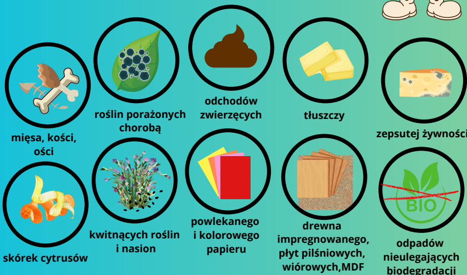
mięsa, kości, ości