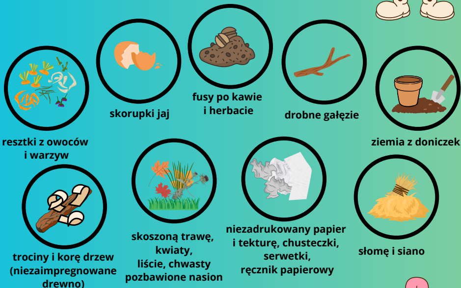
resztki z owoców i warzyw